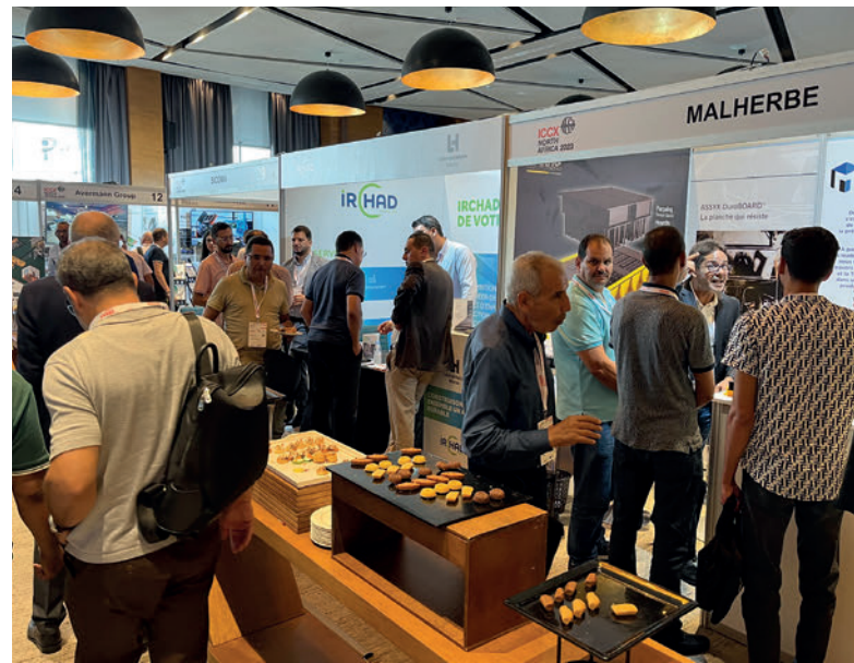
Numerosos expositores se presentan en la ICCX North Africa.

Los próximos años prometen ser una edad de oro para la industria marroquí de la construcción, impulsada por una serie de grandes proyectos. Marruecos coorganizará la Copa del Mundo de 2030 con España y Portugal, un acontecimiento que impulsará significativamente el sector de la construcción. 2025 también se caracterizará por los Campeonatos Africanos de Fútbol. Además, la construcción de plantas solares, presas y muchos otros proyectos estructurales contribuirán a un crecimiento sin precedentes de la industria marroquí en los próximos años. Participar en la ICCX North Africa 2025 es la oportunidad ideal para debatir, intercambiar ideas innovadoras y establecer asociaciones estratégicas en un entorno en el que las perspectivas de crecimiento de la industria del hormigón son más prometedoras que nunca.